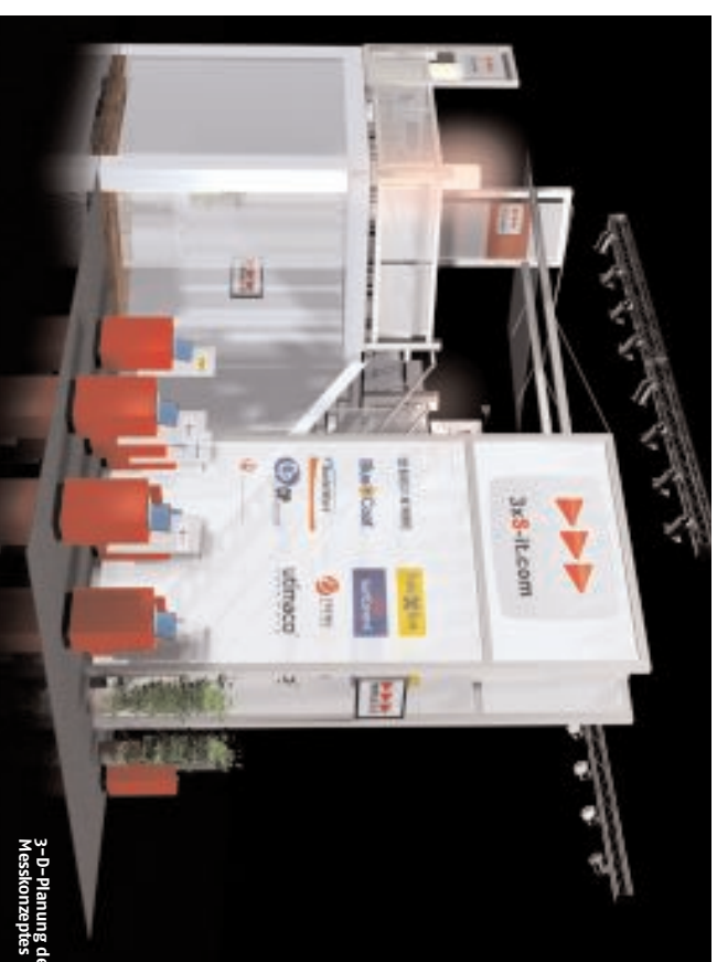
3-D-Planung des Messkonzepts

Hoch hinaus – möchte die Firma Triple Accesss IT, der Spezialist für Security Solutions mit Sitz in Wiener Neudorf auch bei Messeauftritten. Um Werte und Einstellung des Unternehmens entsprechend präsentieren zu können, wurde von den Messeprofis Kreativtechnik aus Leobersdorf ein Individualstand konzipiert.