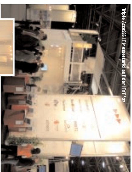
Triple Accesss IT Messestand auf der ITIT '08

Das Besondere: Ein von Kreativtechnik neu entwickeltes „Stockstand“-Konzept. Dieses ermöglicht dem Aussteller, nicht nur in der oberen Ebene attraktiv VIP-like zu präsentieren, sondern auch zu ebener Erde optimale Voraussetzungen für eine gelungene Präsentation zu schaffen. Eine Deckenhöhe von 3,5 m im Basisbereich (im Gegensatz zu den sonst üblichen 2,5 m) nimmt jedem klausurophobischen Ansatz den Wind aus den Segeln.